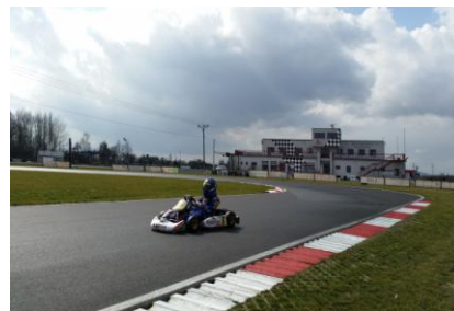
Dráha s restaurací v pozadí